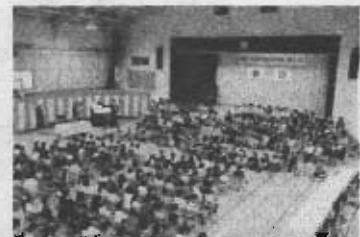
令和6年度 開校50周年記念式典より

そのためには、札幌市学校教育の重点である「子どもの声を聴く」を大切に、子どもの思いや悩みを受け止めたり、学びの主体性を引き出していったりします。子どもの「～たい」(したい・なりたいなど)が様々な活動の中心となるよう取り組んでまいります。